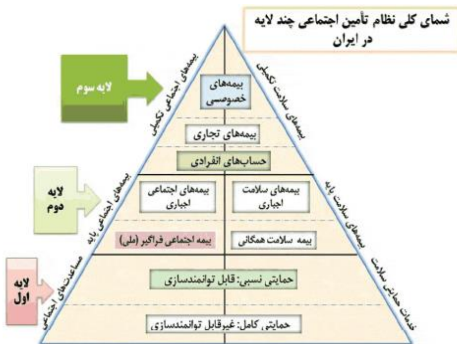
شکل ۱ - نظام اجتماعی تأمین اجتماعی چند لایه در ایران

تأمین اجتماعی روستایی به صورت مجموعه‌ای از راهبردها، سیاست‌ها، مأموریت‌ها و برنامه‌ها به منظور کاهش فقر و آسیب‌پذیری در مناطق روستایی تعریف می‌شود. از این رو برنامه‌های تأمین اجتماعی روستایی در زیرمجموعه برنامه‌های توسعه اجتماعی و توسعه انسانی در سطح ملی قرار دارد. مفهوم تأمین اجتماعی در چارچوب سرمایه انسانی، بر مؤلفه‌های افزایش بهره‌وری و کاهش آسیب‌پذیری روستاییان در مقابل ریسک تأکید دارد. گفته می‌شود اقتصادهای در حال گذار در صورتی که به اجرای نظام تأمین اجتماعی فراگیر سستی خود ادامه دهند، باید هزینه‌های گزافی را بابت آن پرداخت کنند؛ زیرا این روش‌ها برای اقتصاد بازار مناسب نیست و محدودیت‌هایی را برای توسعه اقتصادی آن‌ها فراهم می‌آورد. از سوی دیگر از آنجاکه تأمین اجتماعی روستایی قسمتی از برنامه‌های توسعه انسانی در سطح ملی است و راهبردهای جدید نیز بسترهای اساسی برای تشکیل سرمایه انسانی پیشرو می‌گذارد، از این رو مسائلی نظیر سلامتی، تغذیه، رشد جمعیت و بخصوص فعالیت‌های آموزشی در محور توجه قرار دارد (حیدری، ۱۳۸۴).