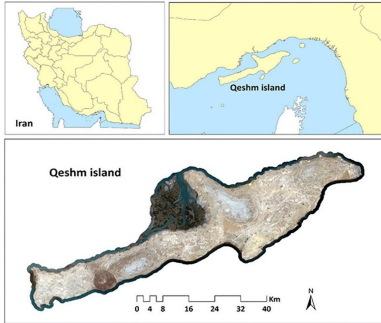
شکل ۱. موقعیت منطقه مورد مطالعه در کشور

از منابع اصلی درآمد مردم این مناطق صیادی و بازارهای تجاری است. در جزیره قشم به دلیل کمی بارندگی و نبود آب شیرین کافی، کشاورزی بسیار محدود است و بیشتر به صورت دیم صورت می‌گیرد و کشت غلات دیم نیز به دلیل یکنواختی بارندگی دستخوش نوسان زیاد می‌شود. همچنین در جزیره قشم معادن گوناگونی از قبیل نمک، خاک سرخ، گاز سنگ آهن و ... وجود دارد که به‌ویژه در گذشته سبب رونق تجاری این جزیره بوده است و قسمتی از مشاغل جزیره نشینان را تأمین می‌کرده است (سازمان سرمایه‌گذاری و کمک‌های اقتصادی و فنی ایران، ۲۰۱۷). روستاهای منتخب این تحقیق شامل سوزا، رمکان، سلخ، سهیلی و طبل بوده‌اند که به دلیل وجود جاذبه‌های طبیعی، فرهنگی و ظرفیت‌های بوم‌گردی، به عنوان کانون‌های اصلی کسب‌وکارهای بوم‌گردی در جزیره قشم شناخته می‌شوند.